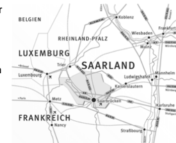
Das Saarland in Europa 1

Die Hochschule für Technik und Wirtschaft des Saarlandes (HTW) in Saarbrücken liegt im Südwesten Deutschlands im Dreiländereck Frankreich–Luxemburg–Deutschland.