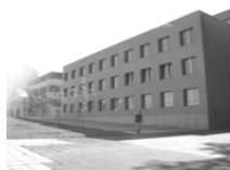
Waldhausweg 14 66123 Saarbrücken

Bauingenieurwesen Biomedizintechnik Elektrotechnik Kommunikationsinformatik Management und Expertise für Pflege- und Gesundheitsfachberufe Maschinenbau Mechatronik / Sensortechnik Praktische Informatik