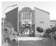
Goebenstraße 40 66117 Saarbrücken

Die HTW des Saarlandes (University of Applied Sciences) ist die staatliche Fachhochschule des Saarlandes. An ihr vermitteln über 100 Professorinnen und Professoren ihren Studierenden praxisnah und anwendungsorientiert das für eine zukunftsfähige Ausbildung notwendige, theoretisch fundierte Wissen. Die Hochschule ist auf vier Standorte in Saarbrücken und Umgebung verteilt: